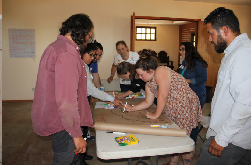
Ensenada. Taller participativo. Agosto de 2022.