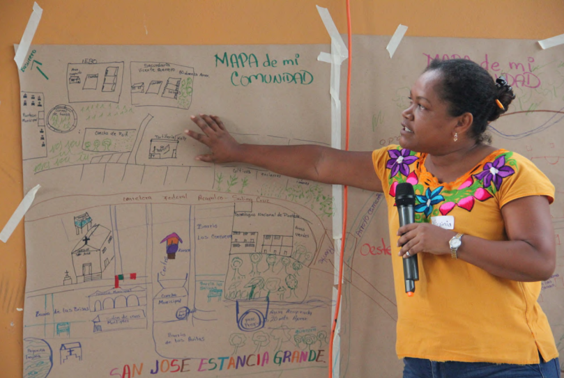
Costa Chica. Taller Participativo. Septiembre de 2022.