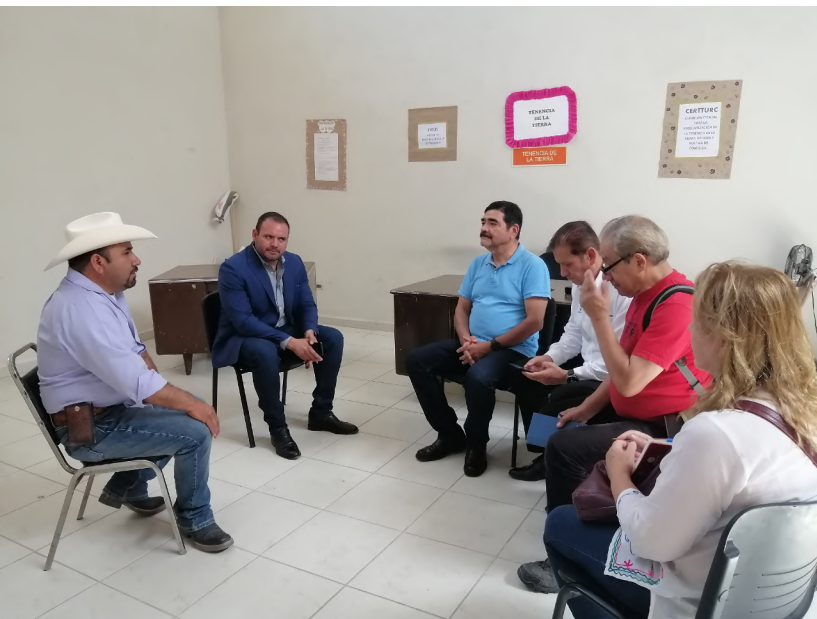
Reunión del Presidente Municipal de Francisco I. Madero con el Equipo Hidrosocial. Comarca Lagunera, Coahuila. Junio de 2022.

[...] contempla la formación de una ciudadanía ambiental, con conocimientos, capacidades y valores, apta para interpretar de manera integral y crítica la realidad que vive y de actuar de manera informada, comprometida y colectiva con el objetivo de promover una gobernanza del agua